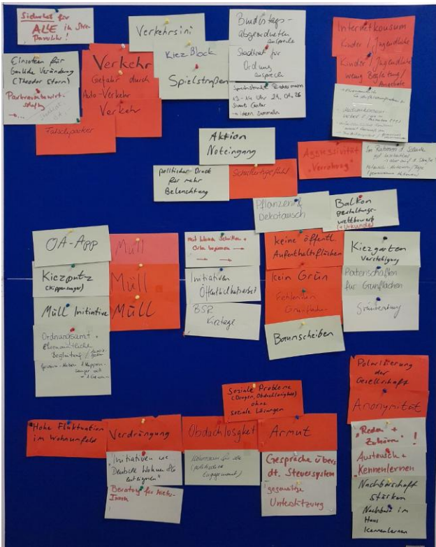
Abbildung 1: Themensammlung QR-Sitzung vom 11.12.2025